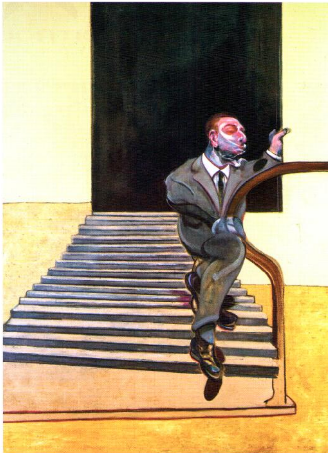
THE ESTATE OF FRANCIS BACON. ALL RIGHTS RESERVED. DACS 2016.