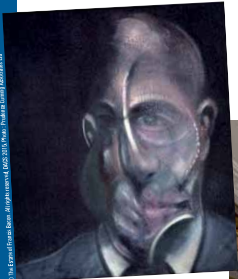
© The Estate of Francis Bacon. All rights reserved. DACS 2015.

Unique fondation au monde entièrement dédiée à l'artiste britannique, la Francis Bacon MB Art Foundation s'est, fort logiquement, avérée être le partenaire incontournable de la future exposition estivale du Grimaldi Forum. Rencontre avec son fondateur Majid Boustany.